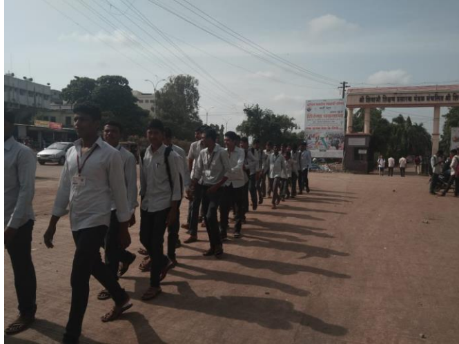
07/08/2019 Cleanliness Camp