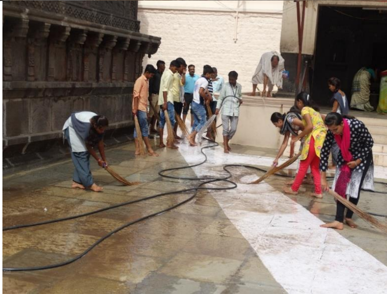
Cleanliness of Bhagwant Temple