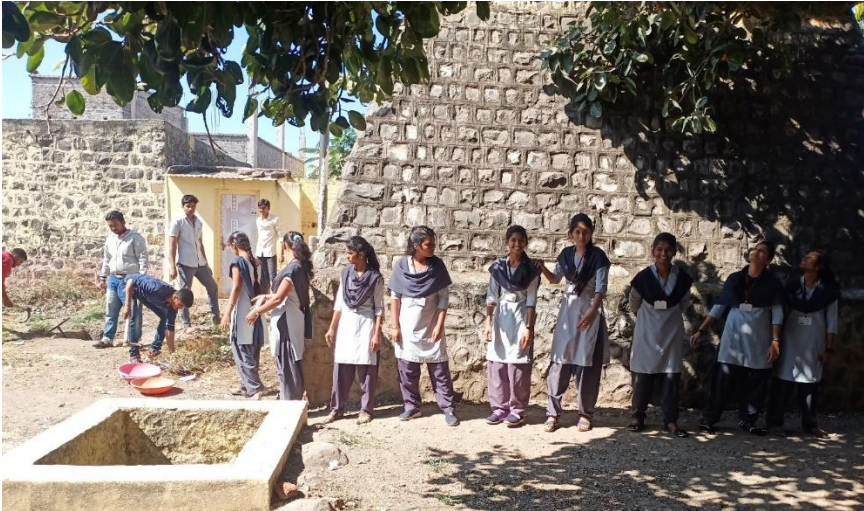
Social Awareness and Clealiness Rally 04/02/2020