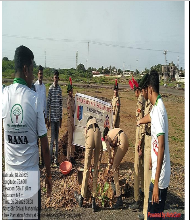
One Cadet One bucket tree plantation