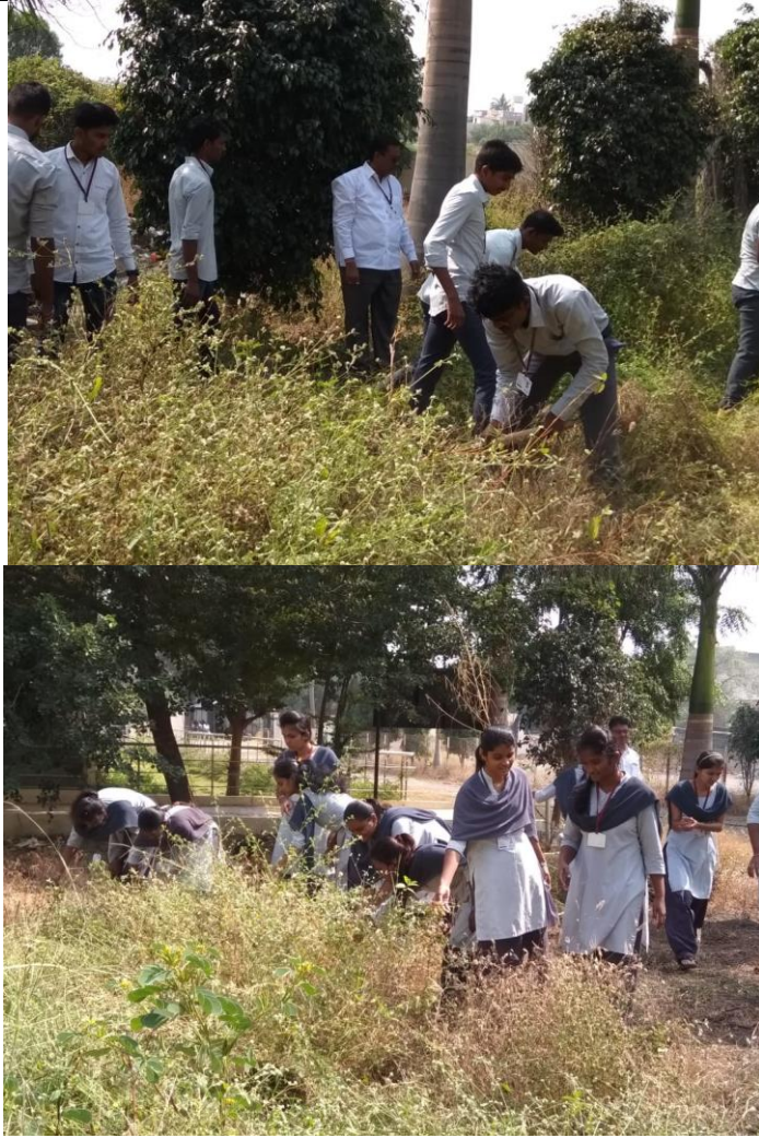
Clealiness Camp in College Campus