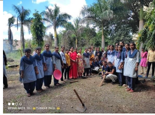
NSS Camp 2022-23 at adopted village shirale