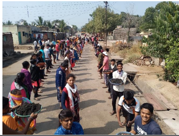
Students participating in NSS camp at Shirale