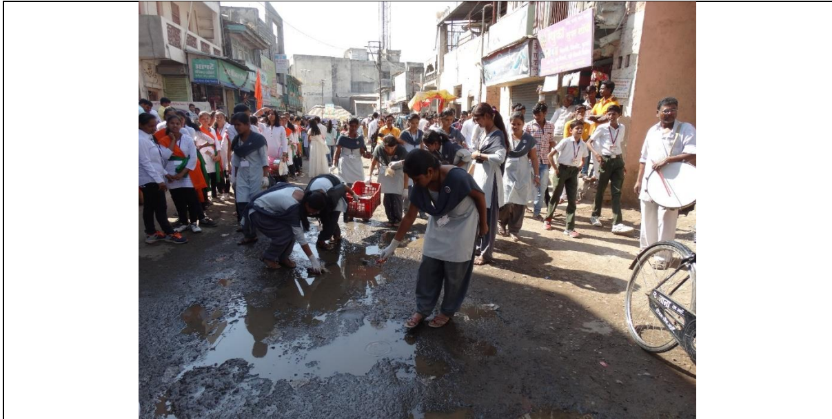
Cleanliness awareness rally (Plastic Collection)