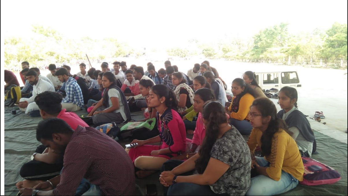
05/03/2020 Programs on environment awareness