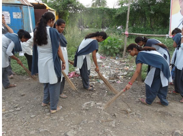
Cleanliness Camp in garden