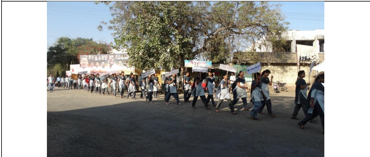
Environmental Awareness rally