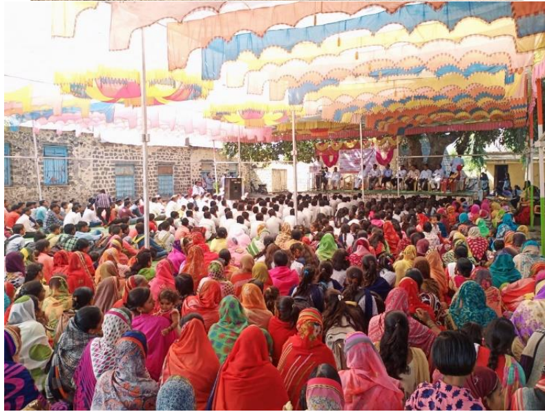
Peoples in Shirale in Program for environment Awareness