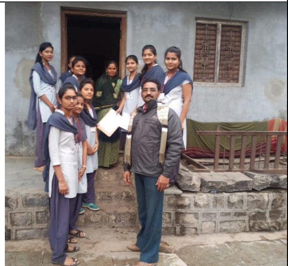
Home Survey made by Volunteer in adopted village Shirale